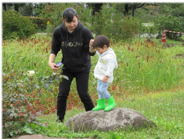
登って、降りて、登って、降りて……