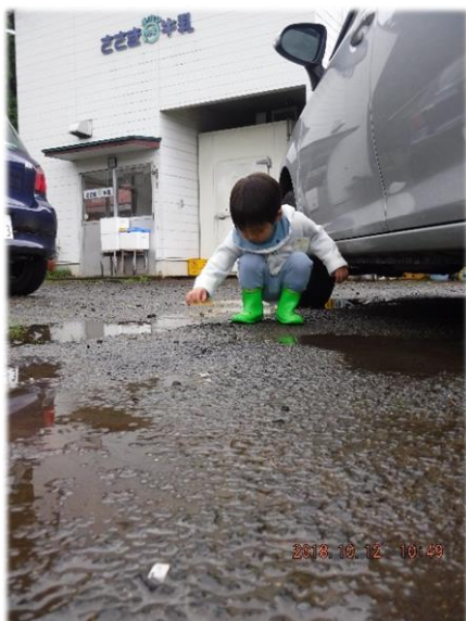
ピッチャ、ピッチャ、ピッチャ