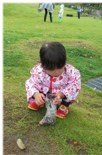
ここにもあった！ (どんぐり拾い)