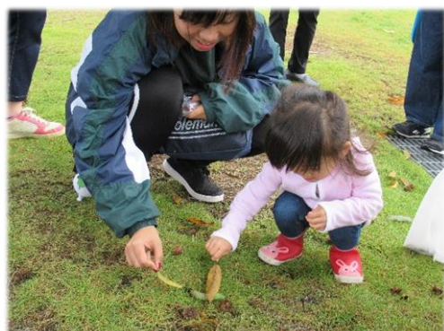
何だ？コレ ツン ツン