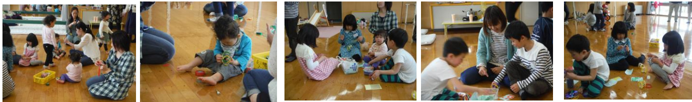
ペットボトルにビニールテープを貼ることに真剣です