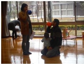
風船を膨らませて・・・