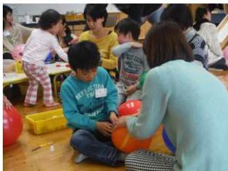
風船にビニールテープを貼ると