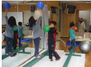
風船を飛ばしたり、ついたり