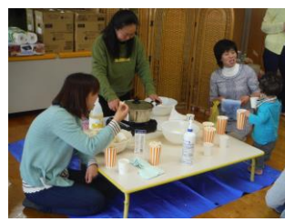
広場で出会った友だちやお母さんと一緒にこんな遊びをしていました。