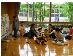
いろいろな人とのコミュニケーションが出来るようになってきました。