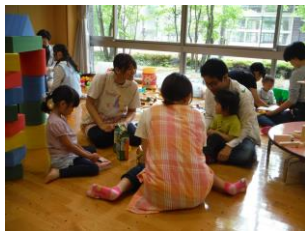
学生のボランティアが始まりました。