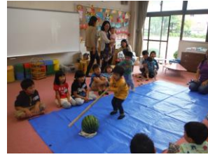
「僕は、ひとりです」長い棒を持って“よいしょ”