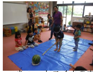
ちょっとスイカの方を変えて 学年が上がったので難易度アップ