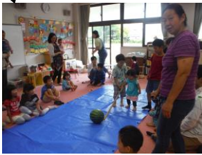
お兄ちゃんと一緒にスイカめがけて“ポン”

ブルーシートを敷いて始まったのは、なんと『スイカ割』です。小さいお友だちからスタートしました。初めての経験だった子がたくさんいました。