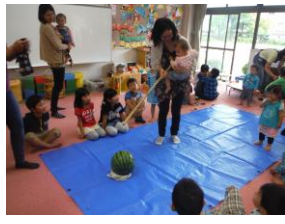
おかあさんと一緒に