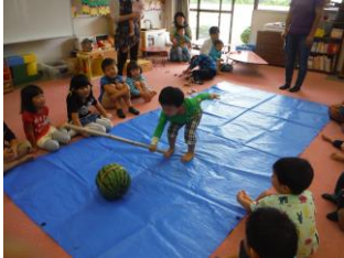
“おれにまかせろ！” おおあたり！！ あっすいかにひびが・・・