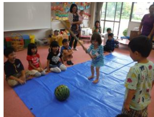
「わたしもがんばる！」 どンドンひびが・・・