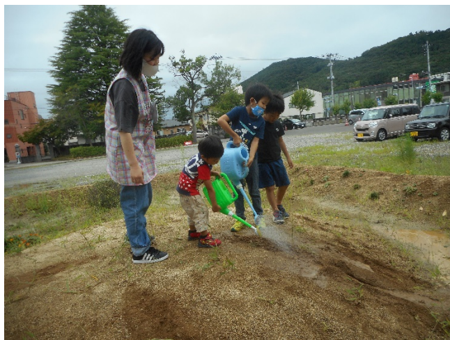
そこに、Hくん、Jくん兄弟が出てきて、3人で一緒に水を流し始めました。 あっという間に、川になっています。2年生学生がついて、遊びのイメージを支えます。 山が、水で削られていくようです。