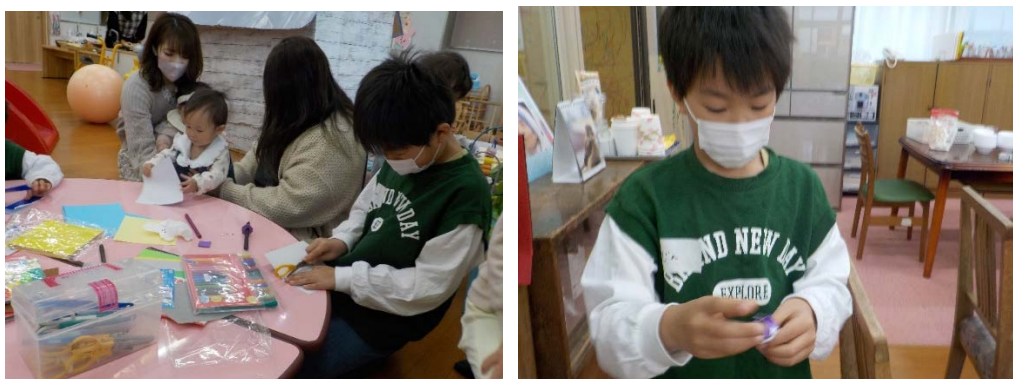
本や見本を見るわけではありません。自分でデザインや構造を考えて作り始めます。