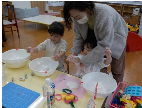
よし、今日は小麦粉粘土を自分たちで作ってみます

さくらっこ広場での学生たちの学びと育ちは、この保育室から、学外の皆さんの暮らしと、たくさん子どもたちの育ちへとつながっていきます。これも、親子の皆さんの大きなお力添えのおかげです。