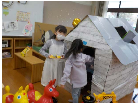
素敵なかーキやパフェを作って、おうちの中のお店に運びます