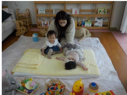
赤ちゃん組は、いとこ同士