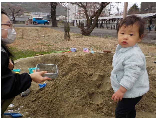
しっかりと自分の足で歩み始めました。寒くたって、砂場で遊びますよ。