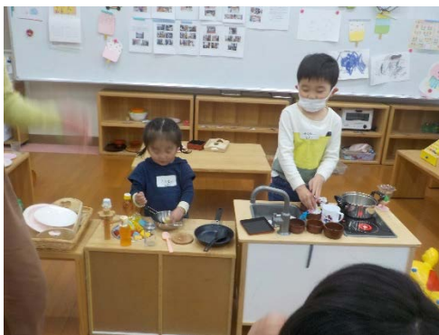
今日は、お姉ちゃんはパパとお出かけ