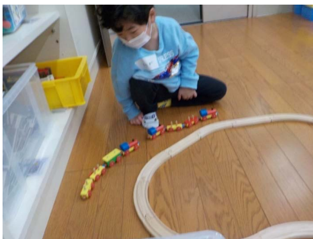
大好きな汽車をつなげます。面白いお話が続きます。