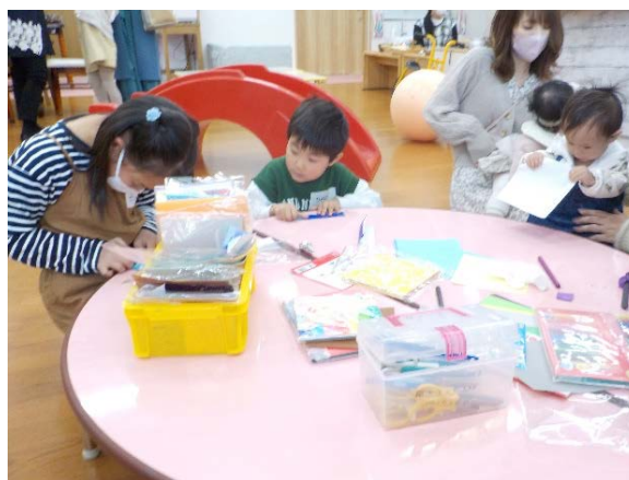
折り紙がいっぱいだね。何を作ろうかな？