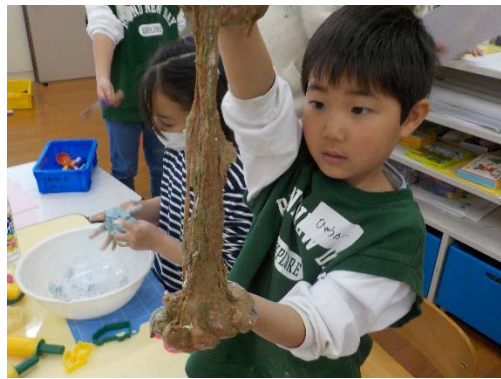
ダイナミックによく伸びる小麦粉粘土・・・色も混ぜて、チョコレート色に・・・