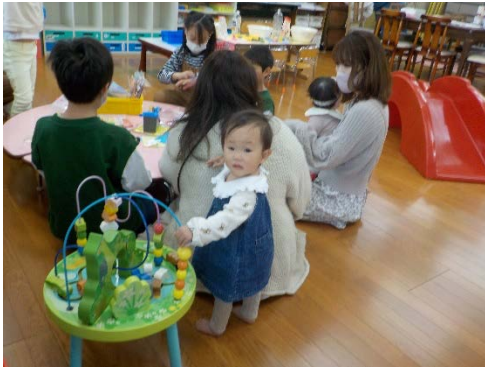
私もちゃんとあそんでるわよ