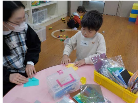
「パクパク」・・・学生が折り方を「教えてもらいました」・・・子どものほうが先生ですね