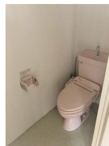
↑お風呂・トイレ別